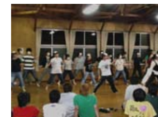
多目的ホールでレクリエーション