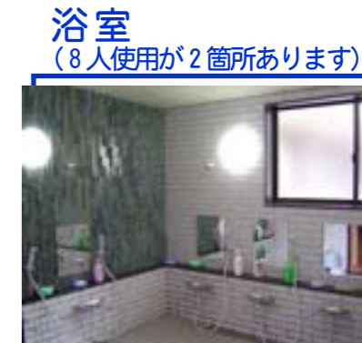
浴室 (8人使用が2箇所あります)