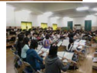
吹奏楽・管弦楽・軽音楽・和太鼓