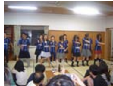
宴会場・ コンパ会場