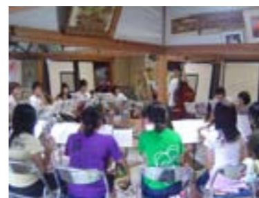
本館練習室 (30 畳)